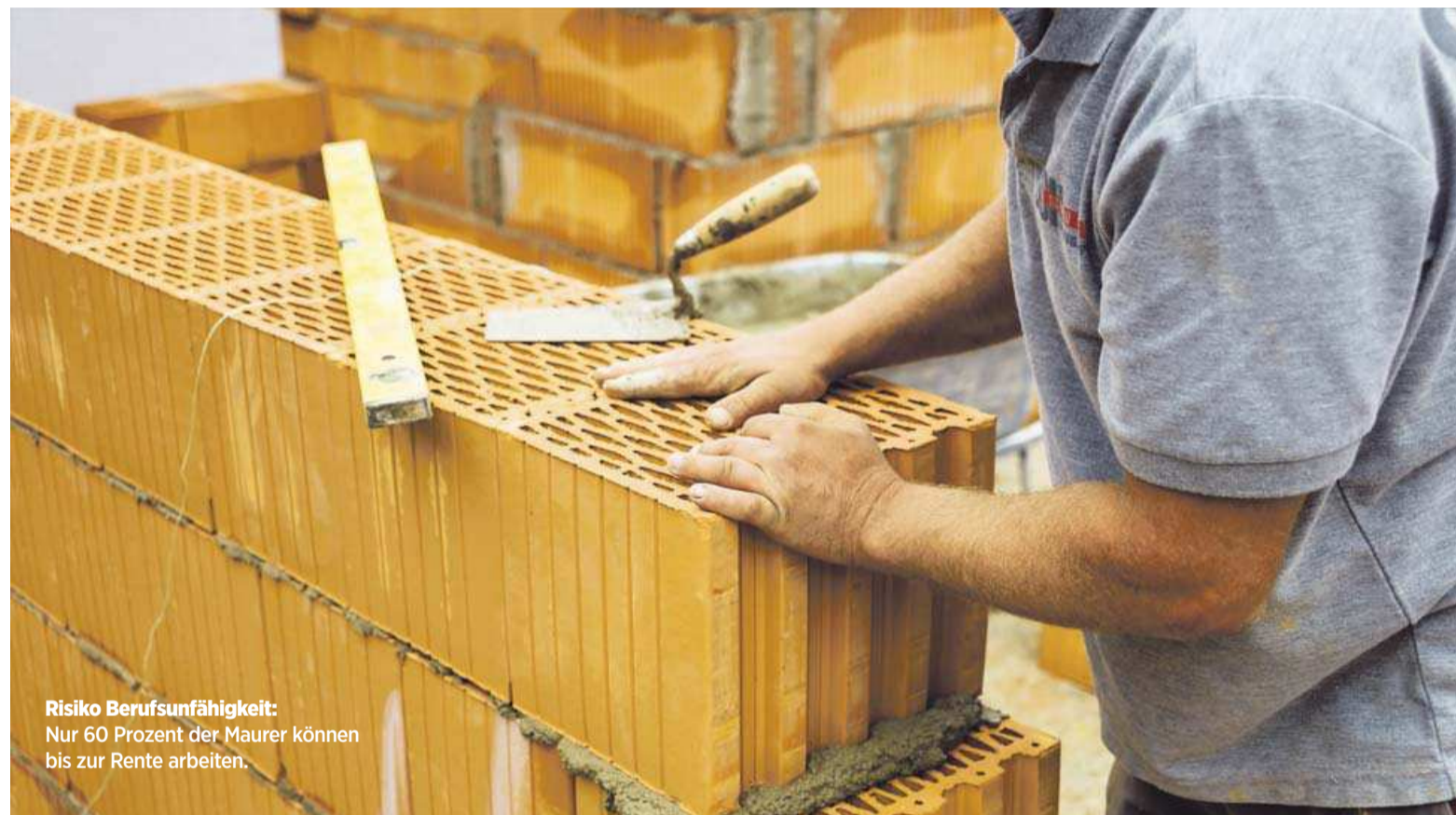
Risiko Berufsunfähigkeit: Nur 60 Prozent der Maurer können bis zur Rente arbeiten.

Vor Gericht tun sich viele Versicherte schwer. Nach einer Studie des Analysehauses Morgen & Morgen gewinnt der Kunde nur gut zwölf Prozent der Prozesse, sechs von zehn Auseinandersetzungen enden in einem Vergleich. Je nach Versicherer variieren die Leistungsquoten stark. Nur acht von 34 Versicherern nehmen 80 Prozent und mehr der Anträge an (siehe Tabelle). Verbraucherschützer rufen im Leistungsfall pauschal zu Anwälten oder Versicherungsberatern. Der Branchenverband GDV sieht keine Probleme. „Die Versicherer zahlten 2014 rund 3,3 Milli-